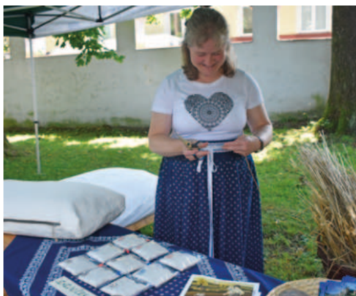
Stružokí z Křivice - starodávné obilniny - K. Muchová