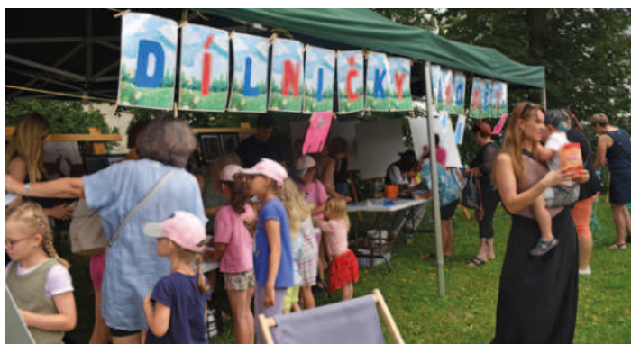
Děti byly z dílniček nadšené