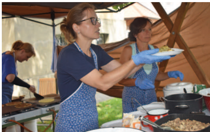
Tradiční plackičky chutnaly všem