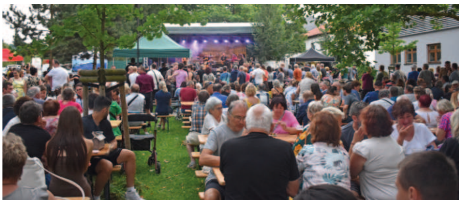
V parku A. Szpyrce bylo plno