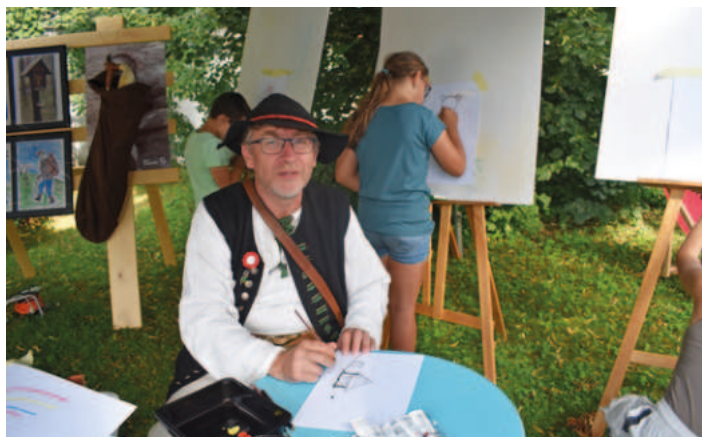
Dílňičky pro děti a inspirace zbojníky a pašeráky - O. Kantor