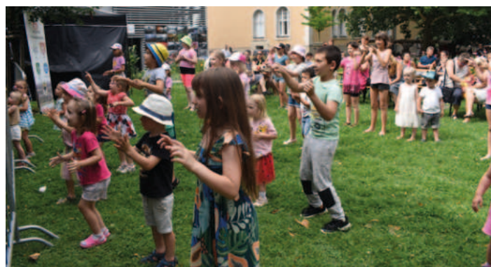
Děti si mohly zatančit s Mini a Miki