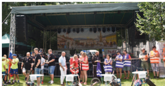
Nechyběl benefiční závod S koloběžkou pro Charitu