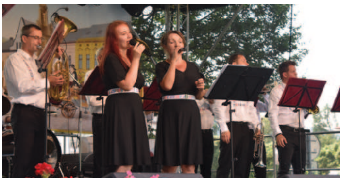
Jablunkovanka již tradičně