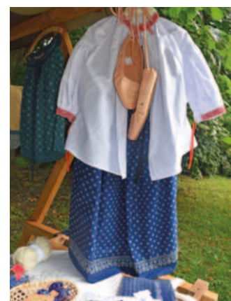
Gorolský kroj z dílny I. Di-Giustové