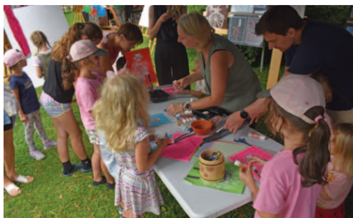
V Jablunkově máme hodně talentovaných dětí