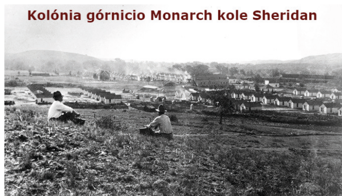
Kolónia górnicio Monarch kole Sheridan