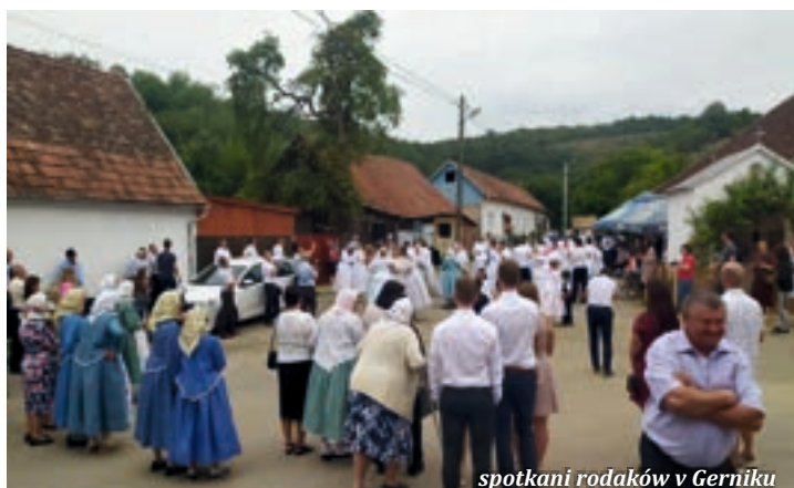
spotkani rodaków v Gerniku