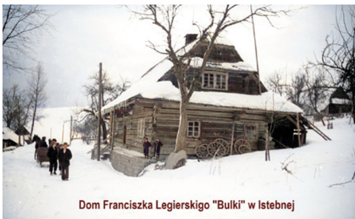
Dom Franciszka Legierskiego "Bulki" w Istebnej